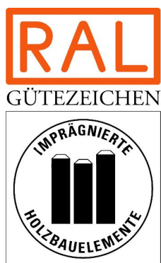
Vollständiges "Gütezeichen „Imprägnierte Holzbauelemente“